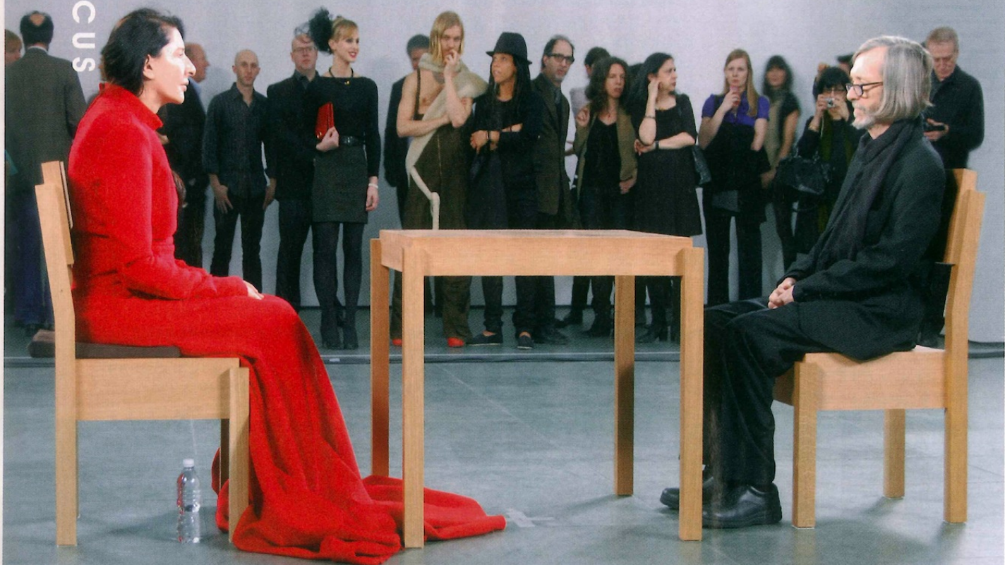
行為藝術家Marina Abramovic（左）在《The Artist Is Present》中，邀請觀眾跟她對坐，作一場沉默的能量交流。